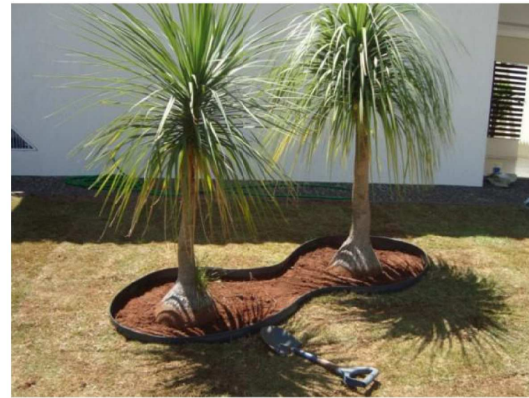
Pata-de-elefante Beaucarnea recurvata