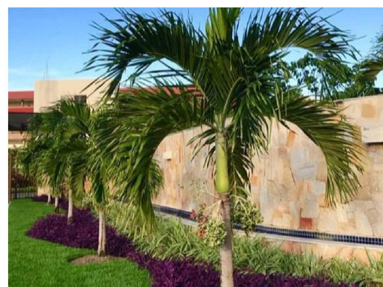
Palmeira Veitchia Veitchia merrillii