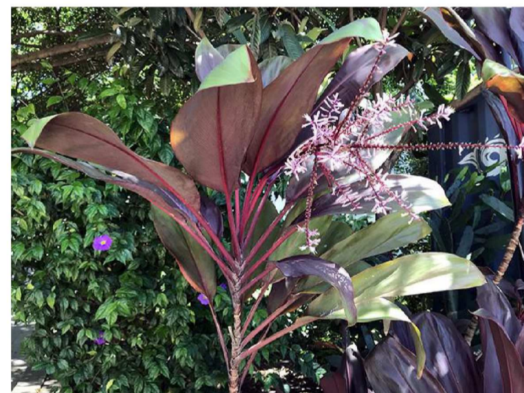
Coqueiro-de-vênus Cordyline fruticosa