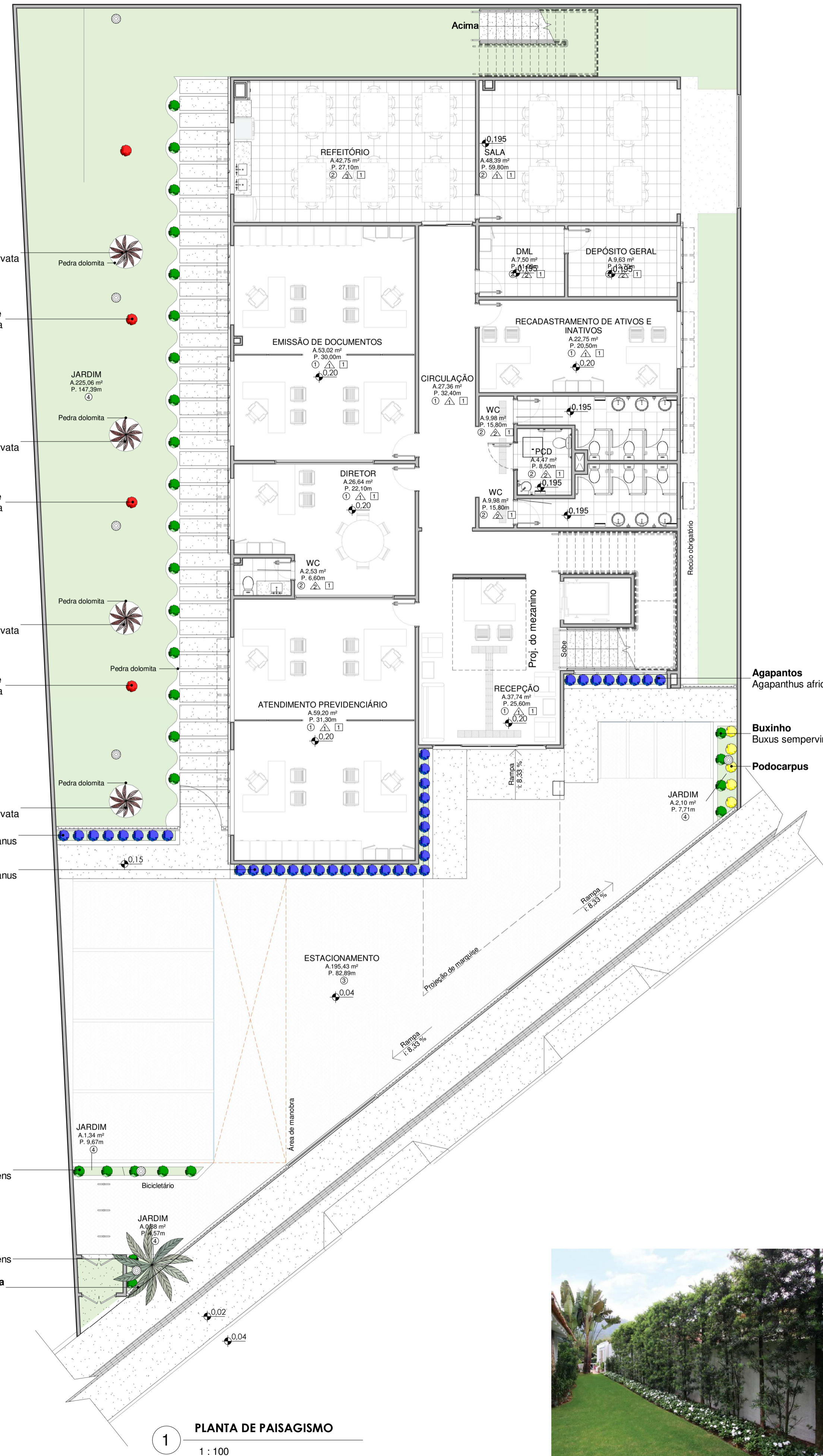
1 PLANTA DE PAISAGISMO 1 : 100