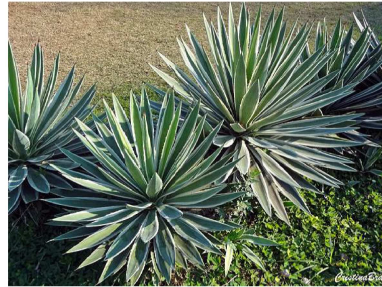
Piteira do Caribe Agave angustifolia